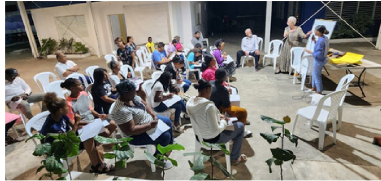
(Kids' program at Handfuls of Hope; discipleship training)