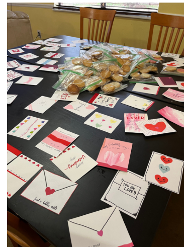
(Con mis amigos en la conferencia; ventajas de la clase de respuesta a desastres; entrega de tarjetas y galletas)