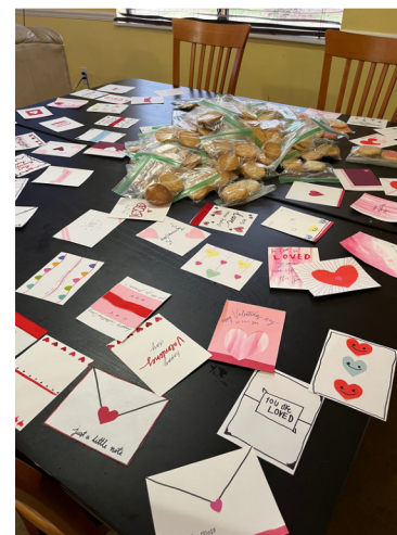
(With my friends at the conference; perks of disaster response class; delivering Valentines and cookies to ARC)