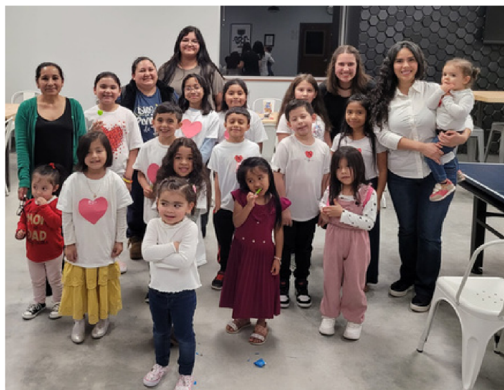
(Todos los niños y maestras después de la presentación)