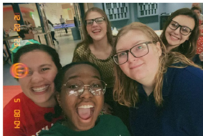
(Harvest Prayer- our weekly, student-led prayer meeting for missions; Christmas tree lighting with friends; Global Ministries class; sports championships with friends; Giving Hope Spanish team!)