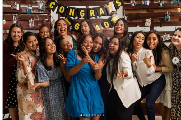
(celebrating graduation with these sweet friends; an airport selfie before we all took different planes to different places)

The mission trip in November went well! The team worked on welding window grilles and putting on the roof. Progress on the mission house was halted toward the end of November, however, due to severe flooding. Unfortunately, the hole for the septic system was also flooded, and all attempts to drain it have been unsuccessful. Because they do not have room on their property to move the septic to another spot, they are looking at purchasing the adjoining property. The owner is currently on vacation, but they are hoping to track him down. Please be praying for a quick and easy resolution to the problem and for God to provide the money to buy the new land!