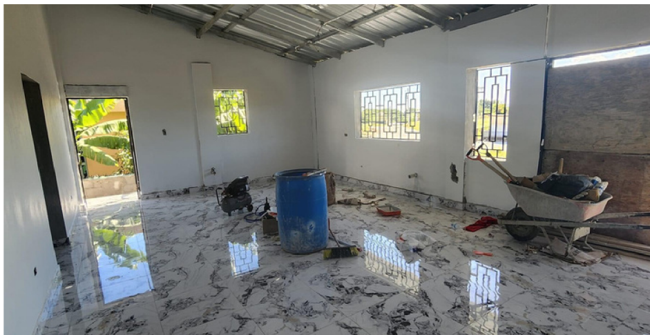
(The guys installing the window grille; tile floor in the mission house; Christmas program with the Haitian kids)